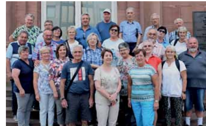
Untervwegs mit Freunden. In Frankfurt nahm die Gruppe Aufstellung für ein Foto, bevor die Heimreise angetreten wurde.

Die Senioren des Bezirkes Oberwart begaben sich heuer auf die Reise nach Ostfriesland. Mit dem Bus ging es von Oberwart, über Passau, Nürnberg, Hannover bis in die ostfriesische Kleinstadt Aurich, von wo wir Ostfriesland erkundeten. Erstes Highlight war die Meyer Werft, in der Kreuzfahrtschiffe wie „AIDA“, „Costa“ oder „Mein Schiff“ gebaut werden, die dann über die aufgestaute Ems in die Nordsee überstellt werden.