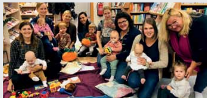
Buchstart-Gruppe. Kinder ab 0 Jahren kommen mit ihren Eltern in die Bücherei und machen ihre erste Erfahrung mit Büchern.