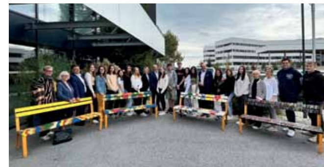
Neuer Look für alte Bänke. Alle Parkbänke, die die Stadtgemeinde zur Verfügung gestellt hat, wurden im Internat-Gästehaus zu neuem Leben erweckt. Zum Thema Nachhaltigkeit wurden die Bänke von Internatsschülern der BAfEP, HBLA/HAK und ZBG Oberwart und den Studenten des Kollegs für Sozialpädagogik (BAfEP) gestaltet.