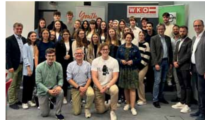
Geschäftsideen umsetzen. Das ist für die Schüler der Handelsakademie ab heuer möglich – auch bei der Youth Entrepreneurship Week.