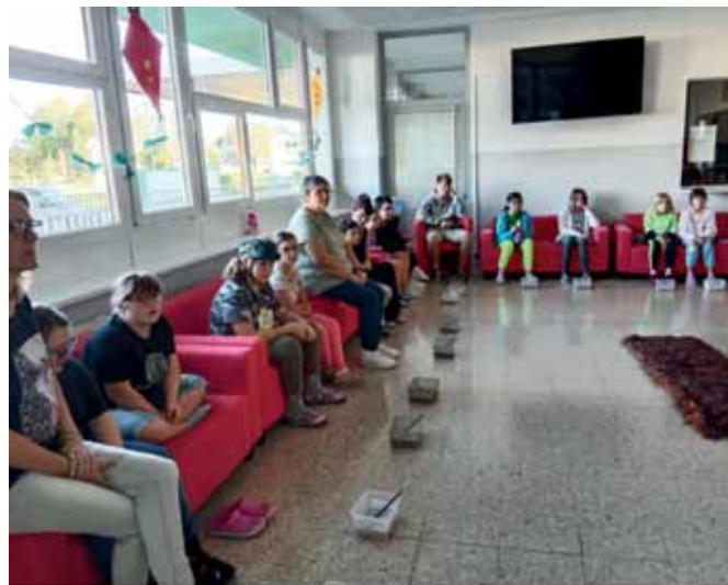
Eintauchen in die Welt der Archäologie. Schüler und Pädagogen waren begeistert von dem Workshop zu Schulbeginn.