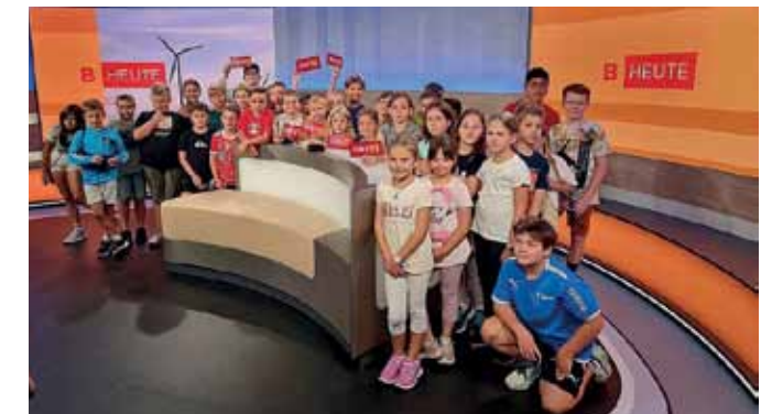
Projekttag der 4. Klassen. Auf dem Programm stand auch der Besuch des ORF-Zentrums in Eisenstadt.

Kinder die Obstsorten mit allen Sinnen erfassen: sehen-fühlen-riechen-hören und schmecken. Alle Schüler waren hellauf begeistert von diesem erlebnis- und lehrreichen Vormittag in der Schule.