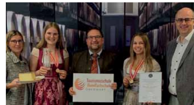
Goldmedaille und dritter Platz. Zwei Schülerinnen der Tourismusschulen zeigen ihr Können als diplomierte Käsekenner.