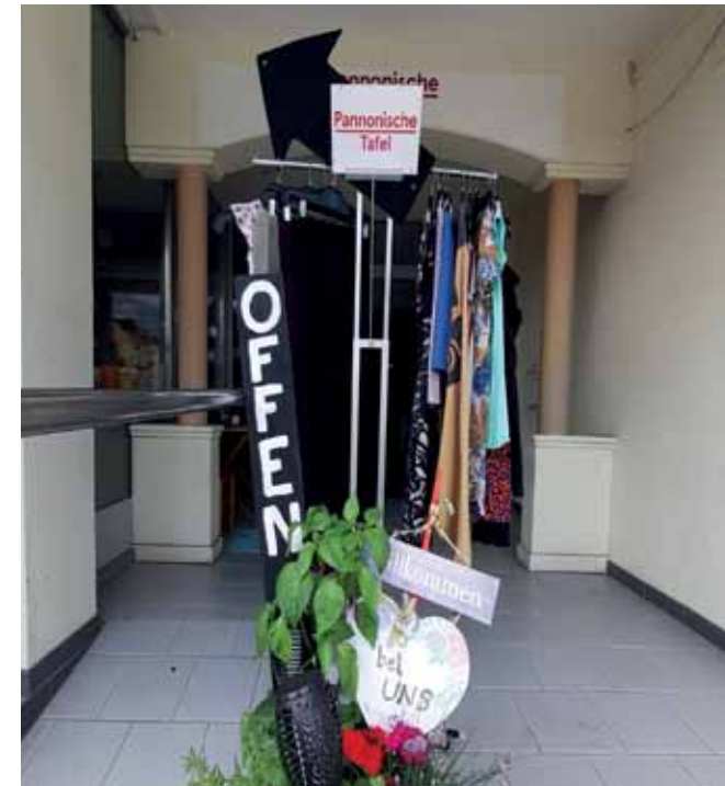
In der Bahnhofstraße findet man das Wohnzimmer der Pannonischen Tafel. Mittwoch und Samstag ist der Begegnungsort geöffnet.

Das Wohnzimmer der Pannonischen Tafel bereichert seit 7. Juni 2023 das Leben in Oberwart. Jeden Mittwoch und Samstag öffnet der einladende Begegnungsort von 10:00 bis 16:00 Uhr seine Türen, und dies ganz ohne Konsumzwang. Das Wohnzimmer ist mehr als nur ein Ort zum Verweilen; vielmehr versteht es sich als offene Begegnungszone, die Raum für verschiedenste Aktivitäten bietet. Der Fokus liegt darauf, Menschen mit geringem Einkommen Freizeitangebote zu bieten – viele Aktivitäten kosten eine Menge Geld und sind im Allgemeinen das Erste, worauf Arbeitslose verzichten (müssen). Unsere Wohnzimmer sind Räume, die Arm und Reich, Jung und Alt, Menschen aus der Umgebung sowie Migrant*innen und Asylwerber*innen auf Augenhöhe begegnen lassen.