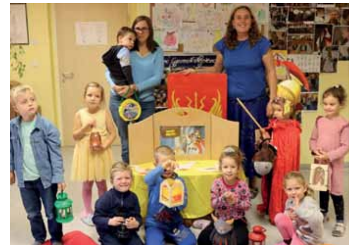
Der Heilige Martin wurde gefeiert. Die Kinder haben beim Erzähltheater viel über den Landespatron erfahren, danach gab es einen Umzug.