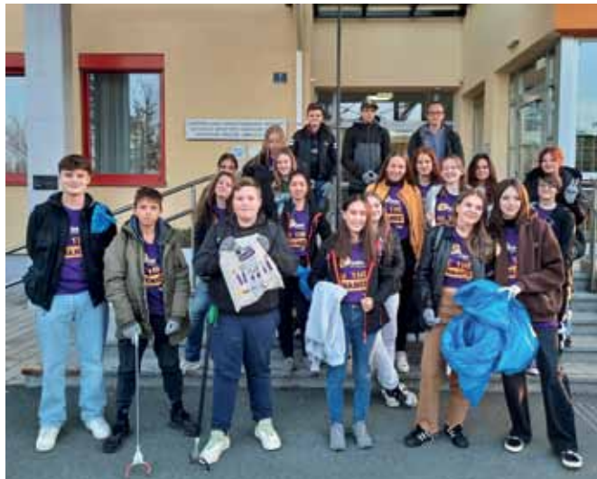
72 Stunden ohne Kompromiss: Bei der Aktion im Oktober waren die Schüler in Oberwart unterwegs, um Müll einzusammeln.