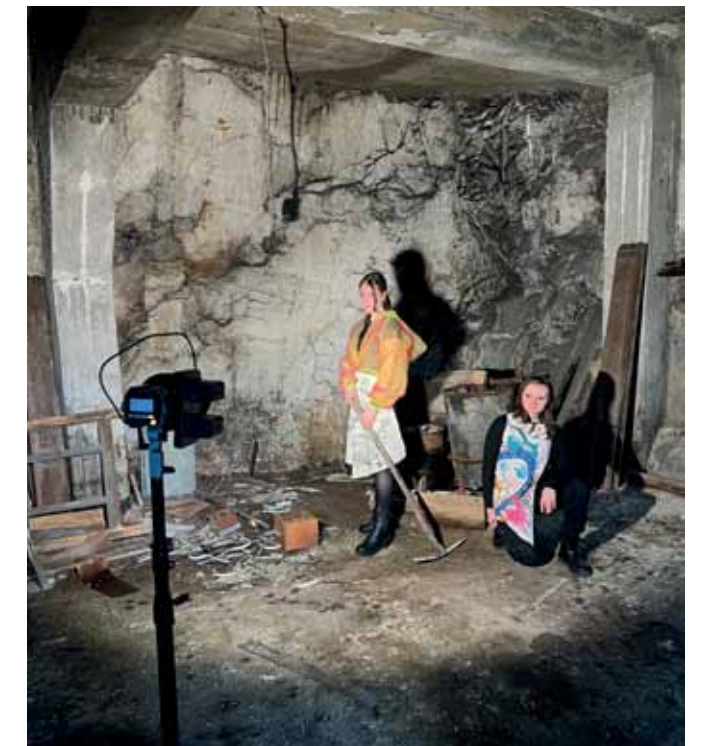
Für das Fotoshooting „Lost places“ kreierten und nähten die Schüler der Modeschule die Kostüme und fungierten als Models.

Als eine von zehn Schulen in ganz Österreich erhielten die Modeschule, HLP, Tourismusschulen und HLW Oberwart im November mit der Entrepreneurship Zertifizierung auf dem „Advanced Level“ in Wien eine besondere Auszeichnung. Insgesamt wurden über 30 Kriterien aus einem umfangreichen Aktivitätenkatalog erfüllt. Dabei steht die Förderung der persönlichen Kompetenzen der Schüler im Mittelpunkt. Die Jugendlichen werden unterstützt, Ideen professionell umzusetzen und Verantwortung zu übernehmen. Das zeigt sich in zahlreichen Projekten, Exkursionen oder bei der Teilnahme an unterschiedlichen Wettbewerben. Die Schüler der Modeschule, HLP, Tourismusschulen und HLW Oberwart organisieren vielfältige Aktivitäten teilweise selbst bzw. arbeiten eigenverantwortlich. Damit sind nach der HAK/HAS („Advanced Level“-Zertifizierung im Jahr 2021) alle Schulen des Business Campus Oberwart auf dem höchsten Level zertifiziert – ein Novum in Österreich, das die hohe Qualität und zeitgemäße wirtschaftliche Ausbildung kennzeichnet.