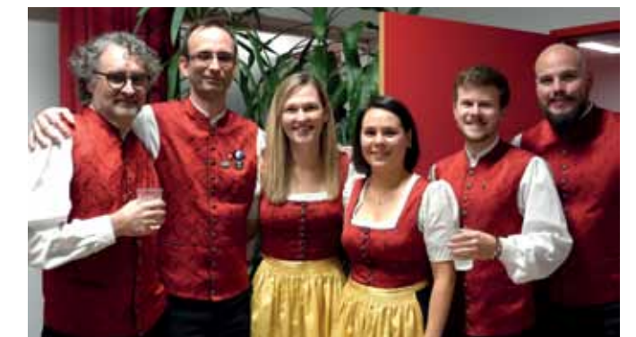
Guter Klang und beste Stimmung beim Martinikonzert. Gäste und Musiker hatten am 11. November einen schönen Abend.

Am 24. Dezember um 18 Uhr spielt die Stadtkapelle Oberwart vor dem Rathaus und sorgt für weihnachtliche Stimmung. Mit dem Lied „Stille Nacht“, welches natürlich wie jedes Jahr gemeinsam