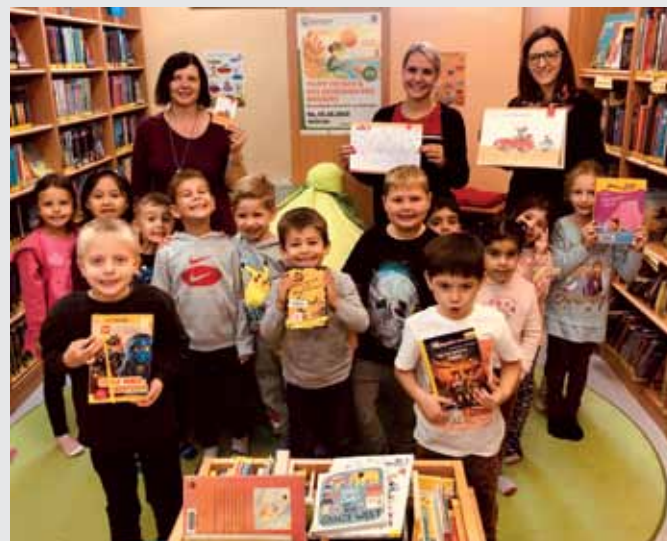
Bibliotheksführerschein für zukünftige Schulanfänger. Das Projekt war schon im Vorjahr ein voller Erfolg und wird fortgesetzt.

Mit dem Städtischen Kindergarten starteten wir nach dem Erfolg im Vorjahr auch heuer wieder das Bibliotheksführerschein-Projekt, in dem alle künftigen Schulanfänger spielerisch die Bücherei entdecken und unterschiedliche Vorleseformate sowie den vielseitigen Medienbestand kennenlernen. Und für Erwachsene gab es mit dem Verlagsfest der edition lex liszt 12 schließlich noch einen bunten Literatur- und Musik-Mix aus dem Burgenland.