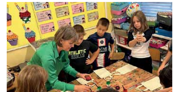
Obst mit allen Sinnen erleben. Gemeinsam mit der Seminarbäuerin wird gezeigt, wie das Obst vom Feld auf den Teller kommt.