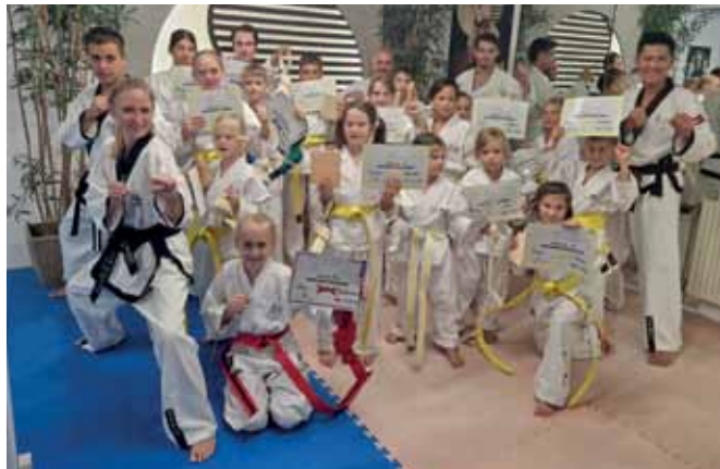
Das Angebot von YU Taekwondo richtet sich an Menschen, die sich körperlich und mental weiterentwickeln möchten.

In der Stadtgemeinde Oberwart hat sich in den letzten Jahren eine bemerkenswerte Erfolgsgeschichte entwickelt. YU Taekwondo, ein Taekwondo-Dojang, der im September 2018 mit nur einem Mitglied begann, hat sich trotz herausfordernder Bedingungen und etlicher Standortwechsel zu einem florierenden Zentrum des Wohlbefindens und der Gemeinschaft entwickelt.