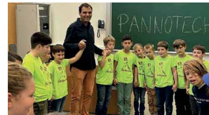
Pannotechnikus-Wettbewerb. Kinder haben die Möglichkeit, das spannende Thema Physik zu vertiefen, das Interesse soll geweckt werden.