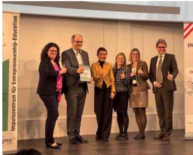
Entrepreneurship Zertifizierung. Als eine von zehn Schulen in Österreich gab es die Auszeichnung für einige Zweige des Business Campus.

Seit Beginn des heurigen Schuljahres präsentieren sich die HBLA und die BHAK/BHAS gemeinsam als Business Campus Oberwart mit einer breiten Palette an attraktiven 5- und 3-jährigen berufsbildenden Schulen: Gemeinsam stark, wenn es um Berufsbildung geht – als Vorbereitung auf den sofortigen Berufseinstieg bzw. für ein Studium!