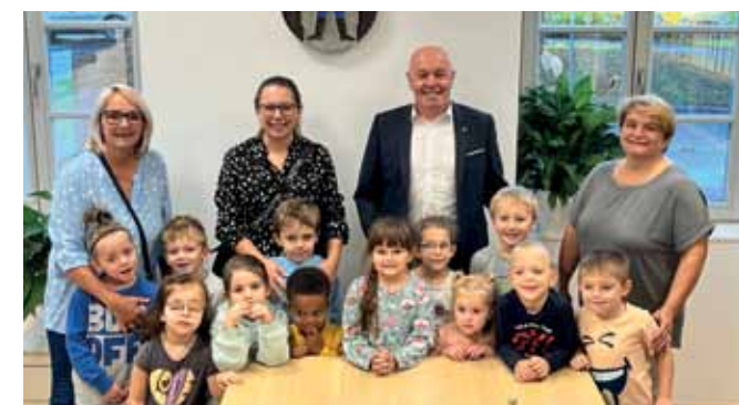
Besuch aus dem Kindergarten. Eine Gruppe hat wenige Tage vor dem Nationalfeiertag das Rathaus besucht und dem Bürgermeister in seinem Büro ein Lied zum 26. Oktober gesungen. Danach gab es noch einen Rundgang durch das Haus.