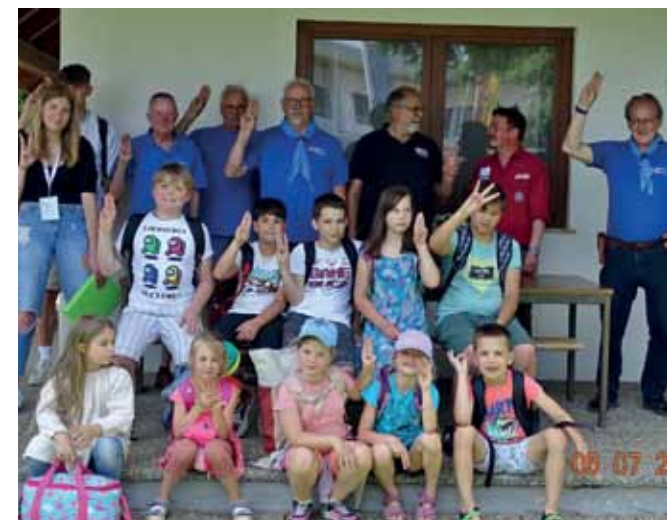
Ein großer Spaß für die Kindersommer-Kids. Zum Programmschwerpunkt „Natur“ gab es einen Besuch bei der Pfadfindergilde.

Im Rahmen des Oberwarer Kindersommers konnten wir am 5. Juli in unserem Pfadfinderheim eine Kindergruppe mit ihren Betreuern begrüßen, die in dieser Woche als Programmschwerpunkt "die Natur" hatten. Gerne gaben wir ihnen einen kurzen Einblick in das Pfadfindertum, das heute mit 41 Millionen Kindern die größte weltweite Jugendbewegung ist. Von der Gründung vor mehr als hundert Jahren durch den Engländer Lord Baden Powell, der sich für eine gewaltfreie und friedliche Jugendarbeit einsetzte, dem der Naturschutz und das Zurechtfinden in der Natur wichtig war, genauso wie der verantwortungsvolle und hilfsbereite Umgang mit anderen Mitmenschen.